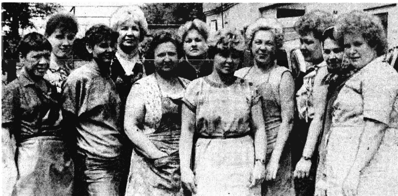
На снимке: работницы цеха № 4.

Трудовую деятельность начал в 1961 году печатником Москаленской районной типографии Омской области. После окончания института работал электромехаником, старшим инженером девятой дистанции сигнализации и связи Тайгинского отделения Западно-Сибирской железной дороги. С 1970 года по 1983 год находился на комсомольской работе: первый секретарь Тайгинского горкома ВЛКСМ, заведующий отделом, второй, первый секретарь Кемеровского обкома ВЛКСМ. После окончания аспирантуры АОН при ЦК КПСС с августа 1986 года — первый секретарь Центрального райкома КПСС города Кемерово.