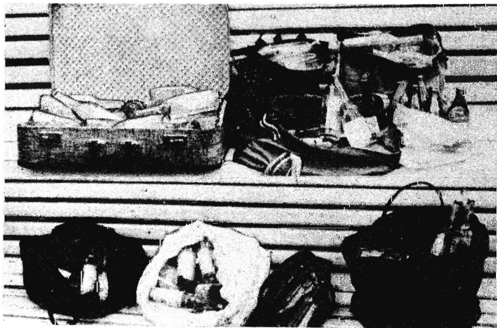
На снимке: конфискованное спиртное, приготовленное для спекуляции.

В дежурную часть городского отдела ежедневно поступает 5—8 сигналов о кражах государственного имущества со складов, магазинов, предприятий, организаций го-