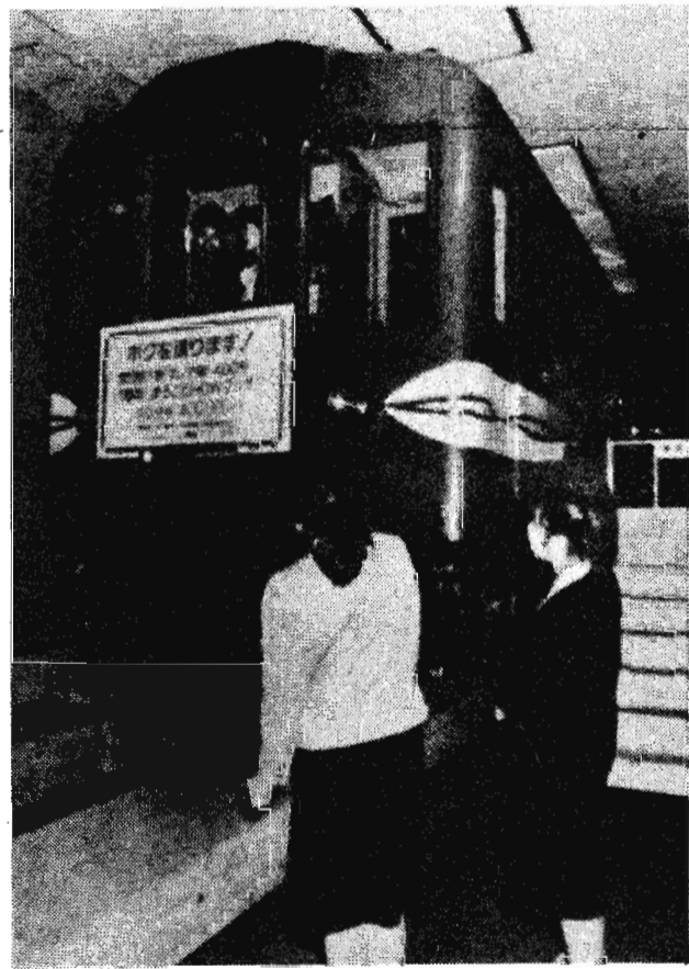
В Токно состоялась необычная распродажа... спящих вагонов метрополитена. Казалось бы, кому они нужны? Оказывается, многим. Покупатели, как крупные компании, так и частные лица, рассчитывающие использовать вагоны для устройства в них маленьких кафе и лавочек для продажи сувениров. Их расчет прост: японцы — люди сентиментальные и вряд ли пройдут мимо вагона, к которому они привыкли более чем за тридцать лет путешествий по колеям Токийской подземки...