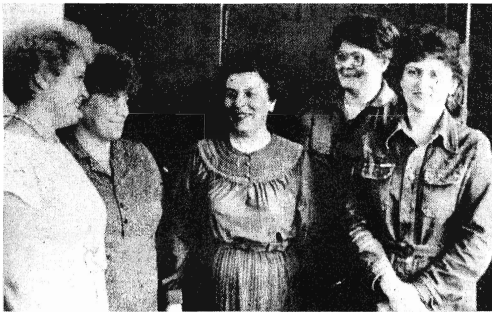
Число предприятий города, перешедших на арендный подряд, пополнилось еще одним — им стало УМДиРГШО-1, занятое монтажом и разборкой всех механизированных комплексов в объединении «Ленинскуголь».

Сразу вслед за подписанием приказа, узаконивающего права УМДиРГШО как самостоятельного предприятия, в управлении собрался совет трудового коллектива. Ему надлежало утвердить временное положение, связанное с переходом на арендный подряд, а также выработать тактику и стратегию работы коллектива в новых условиях.