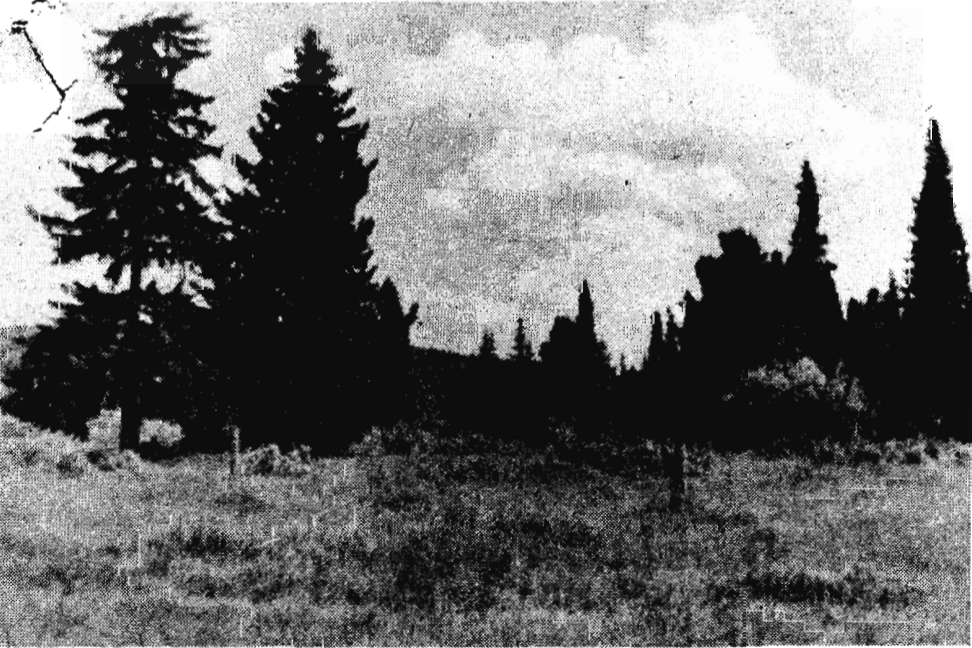
На фотоконкурсе „Ленинского шахтера“