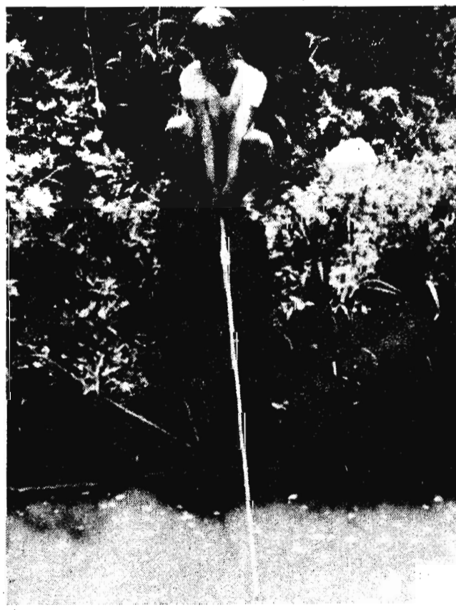
Таежная река. Ловись, рыбка!