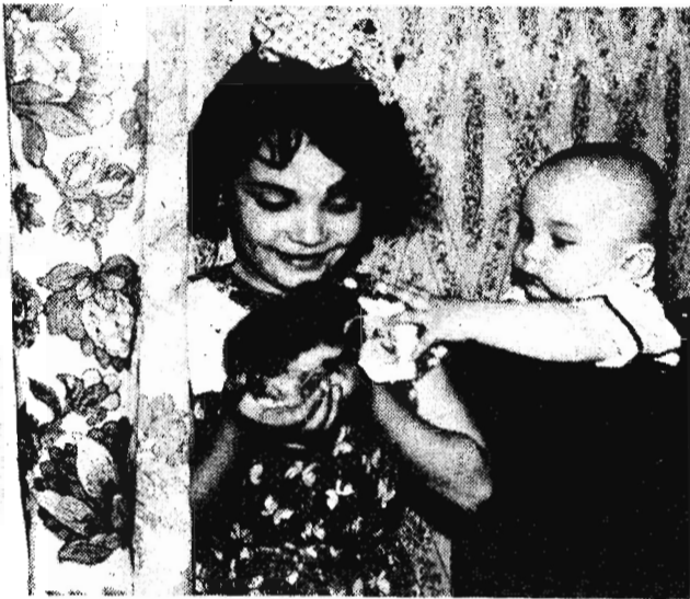
Дай погладить!