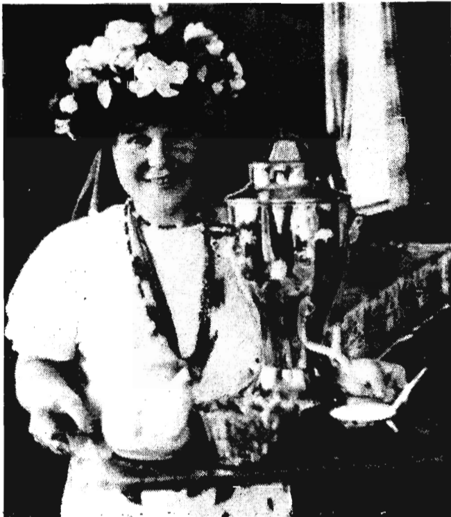
Несколько лет назад в адрес коллектива столовой № 15 было немало нареканий от горняков шахты «Кузнецкая». Но последнее время коллектив перестроил работу, стал качественнее готовить блюда. Неоднократно в столовой № 15 проводились дни национальной кухни. Сейчас горнякам по душе приходятся те национальные блюда, которые готовят повара столовой № 15.

Основное же событие, минувшей недели в ходе обсуждения Устава — конференция рабочих комитетов предприятий города, отчет о которой мы публикуем на второй странице сегодняшнего номера.