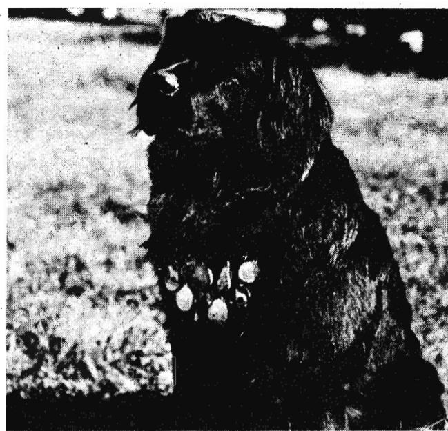
В зените славы.