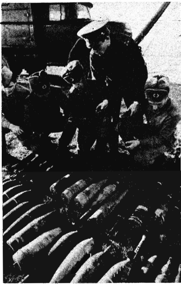
На Юргинском полигоне продолжают греметь взрывы. Это идет уничтожение боеприпасов, собранных саперами в округе 150 квадратных километров.

Оргкомитет распространит «Воззвание Хиросимы и Нагасаки». Для сбора подписей под ним можно организовать специальные пункты. Информацию о наиболее интересных мероприятиях «Волны» и количестве собранных подписей можно направить в Советский комитет защиты мира или японский оргкомитет по адресу: Генсуякино 6-19-23, Симбаши, Минато-ку, Токио, Япония. Справки по телефону 26-38-32 в областном комитете защиты мира.