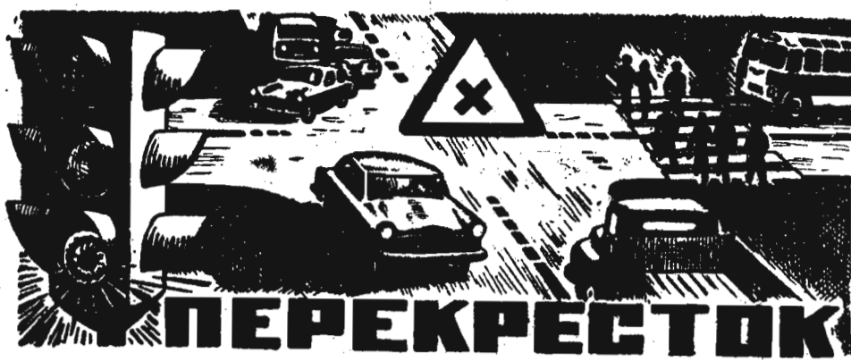
Выпуск № 10 (115)