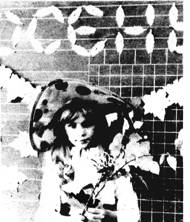
Сколько фантазии, умения, терпения проявили ребята и их родители, чтобы сделать осенний праздник красивым!

Сколько фантазии, умения, терпения проявили ребята и их родители, чтобы сделать осенний праздник красивым!