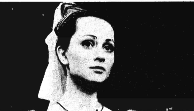
Приключения Квентина Дорварда, стрелка королевской гвардии