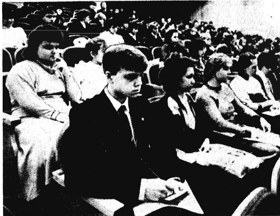
В зале конференции.

Кстати, помнит ли, на прошлой конференции организаторы устроили конкурс комсомольской песни. И знаете, ведь участвовали в нем многие. Звучали в фойе песни и прошлых лет, и современные. Объединили они ребят. Сегодня же отделились видеофильмами. А зря. Молодежь должна оставаться молодежью. Пусть были бы и песни, и танцы. Не помешала бы непринужденность в перерывах.