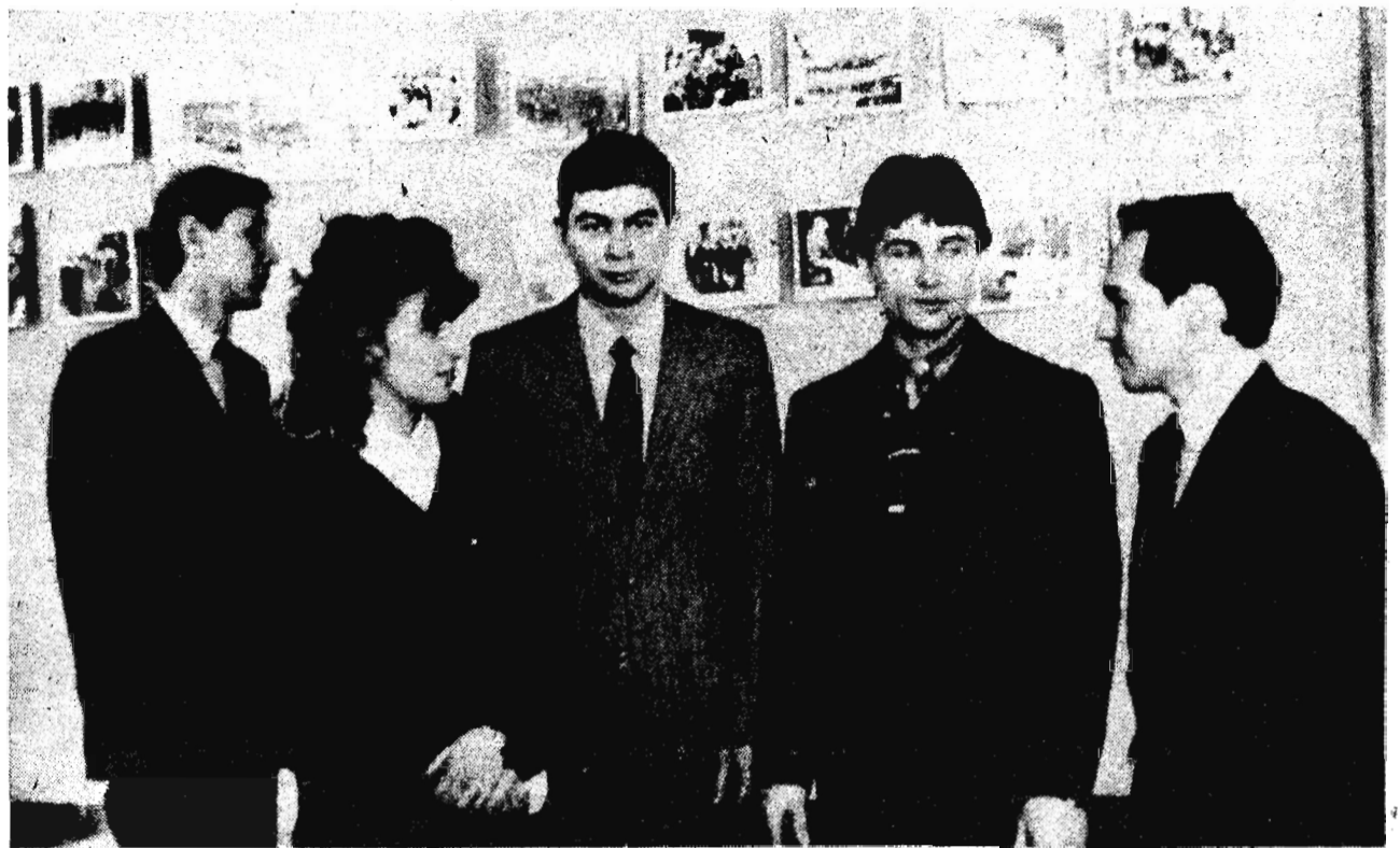
Делегация шахты имени Кирова.

Словом, наша оценка основана на невнимании горкома ВЛКСМ к делам первичных организаций.