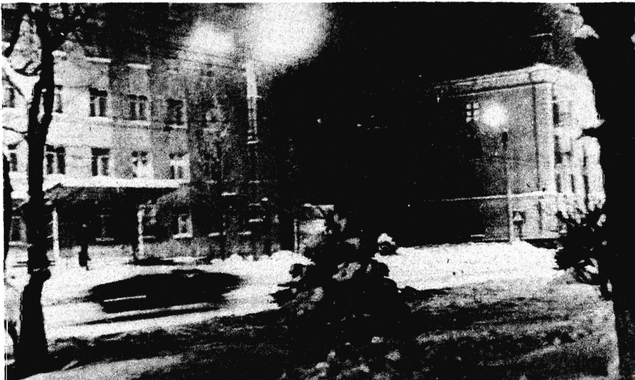
На фотоконкуре «Ленинского шахтера» Ночной город.

Оставляют на бегу Две полоски на снегу. (яички) Н. ИПАТОВА.