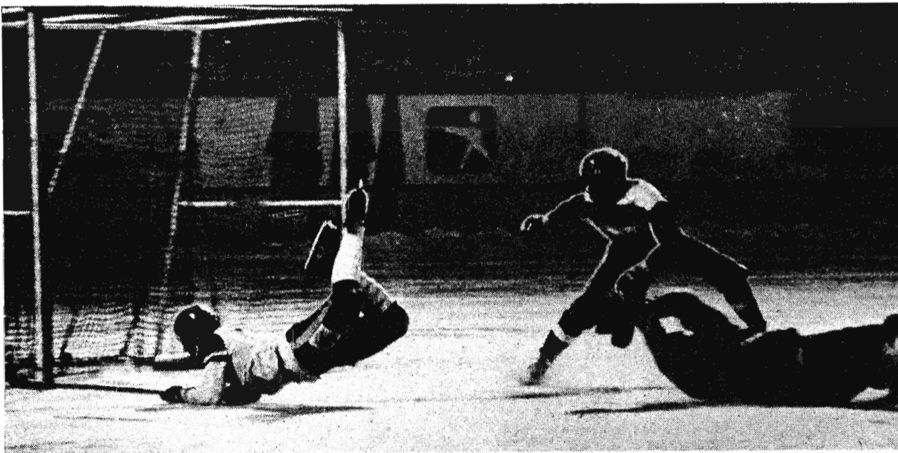
На фотоконкурсе «Ленинского шахтера»