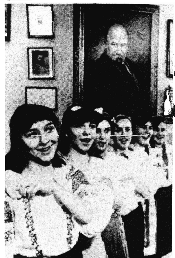
Имени Т. Г. Шевченко

Инженер по организации социальности фабрики «Одежда».