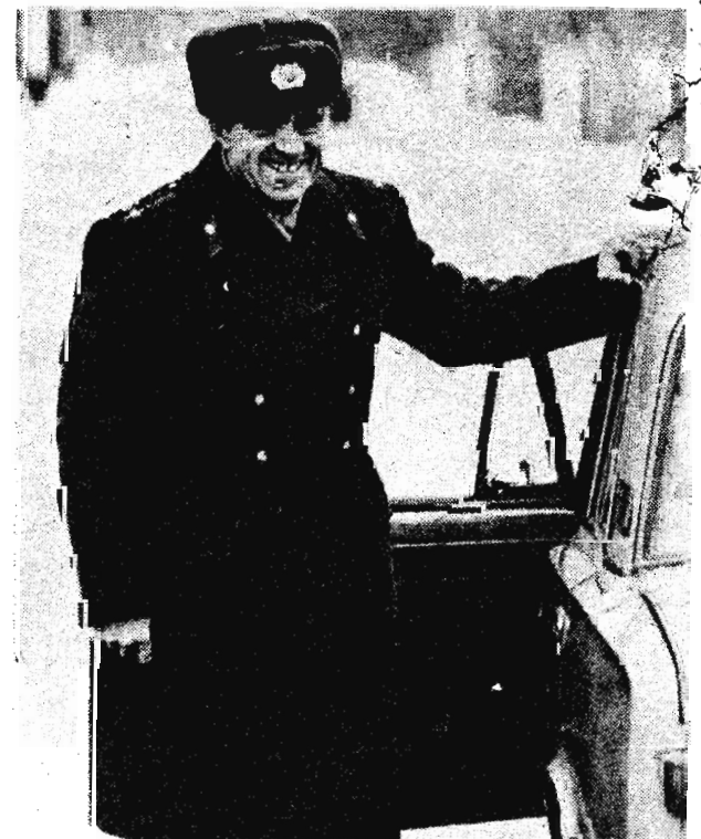
По Кузбассу Снова в строю

И. МЕЛЬНИЧЕНКО. Внештатный корреспондент.