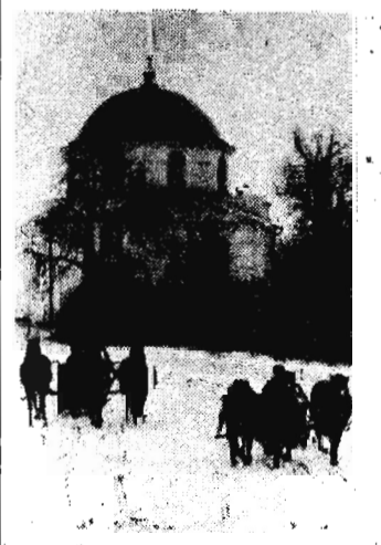
На снимке: на окраине Диканьки сохранился Николаевская церковь — памятник архитектуры начала XVIII века.

На снимке: этот бронзовый бюст писателя (скульптор — народный художник СССР А. А. Ковалев, архитектор — В. С. Шевченко) установлен на территории музея-заповедника в Гоголево.