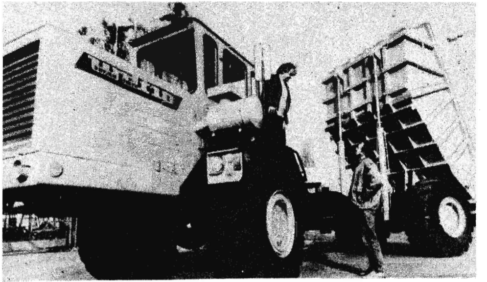
Автомобильная промышленность — быстро развивающаяся отрасль народного хозяйства Польши. В стране выпускаются различного типа легковые и грузовые автомобили, большая часть которых экспортируется в страны — члены СЭВ.