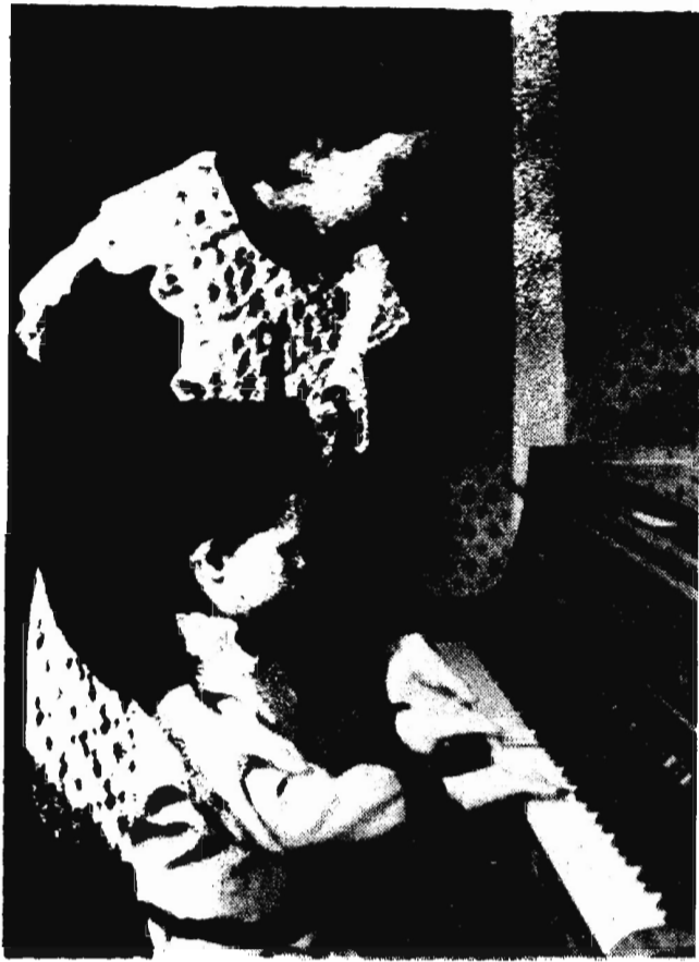
Старшая сестра.