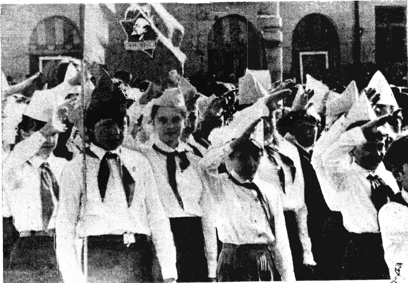
Мы — пионерия, мы все на марше!