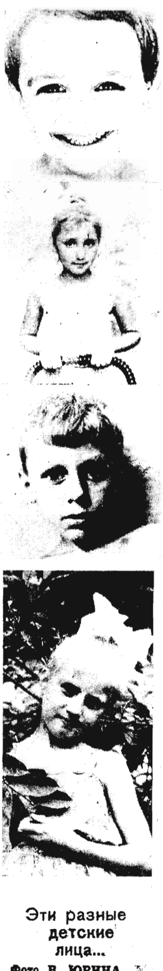
Эти разные детские лица...