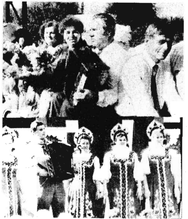
Праздник в Польсаеве

На снимках: фрагменты праздника.