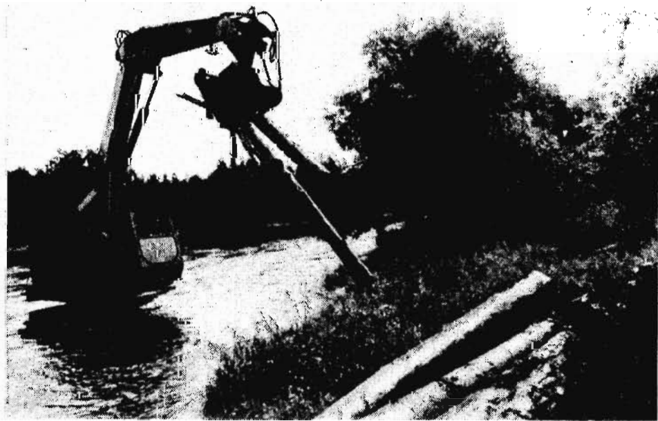
Сорок лет вели сплав леса по сибирским рекам Оке и Зиме, что в Иркутской области.

Разговор о рынке состоялся в нашей первичной партийной организации 29 августа было собрание коммунистов шахты. Участники его приняли несколько серьезных положений, касающихся перехода к рынку. В первую очередь, собственность государственных и колхозно-кооперативных предприятий надо передать трудовым коллективам, которые решают вопрос о необходимости изменения формы собственности и самостоятельности предприятия. До начала перевода экономики на рыночную форму необходимо провести денежную реформу, то есть эквивалентный обмен денег при предоставлении декларации о доходах на