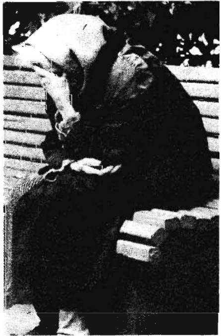
гастронома «Новоарбатский» нынче пусты; ее жизнь прошла в очередях.

На снимках: хочешь полакомиться — сначала постой; прилавки столичного