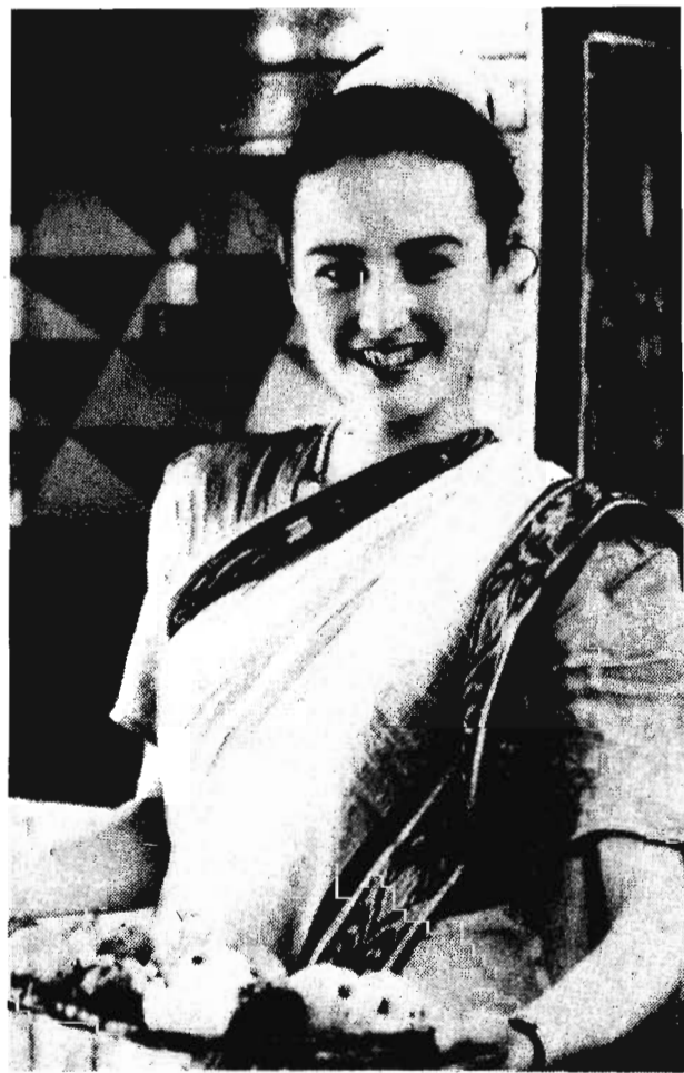
Встреча в „Лотосе“

Слово теперь за вами, те, кому за... И правда, не будем уточнять принципы этого возраста. Кстати, пока предварительные создатели клуба называли его «Золотой возраст», но окончательное мнение и название клуба за его посетителями. По секрету скажем, что победителя в этом маленьком первом конкурсе ждет сюрприз. С. ЛЕНСКАЯ.