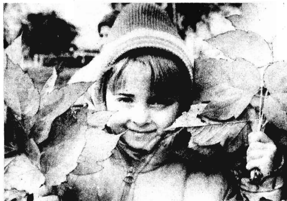
А листья почему-то не зеленые, а как огоньки...