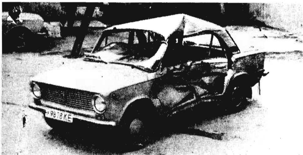
— Кататься любишь, а правила знаешь?