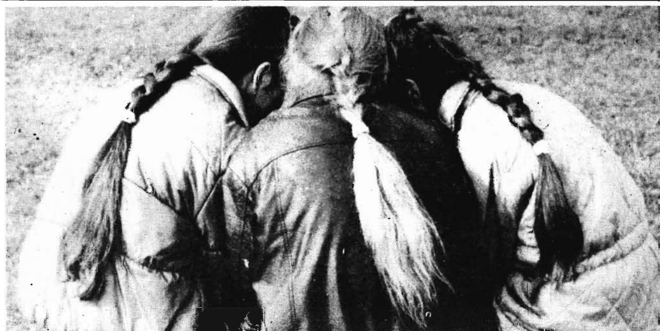
Огромный такой секрет...

Повторюсь: очень хочется, чтобы академики, планирующие очередную эксперимент, побыли бы, грубо говоря, в нашей шкуре, месяц-другой пожили бы так, как мы живем, глядишь — и результат их труда был бы другой. И в то же время народ наш, умный и грамотный, разучился по-настоящему работать. Откуда будет изобилие? Если выращенный картофель (80—82 млн. тонн) не доходит до стола потребителей, теряется 12,8 млрд. рублей! Да таких примеров можно привести сотни. Ры-