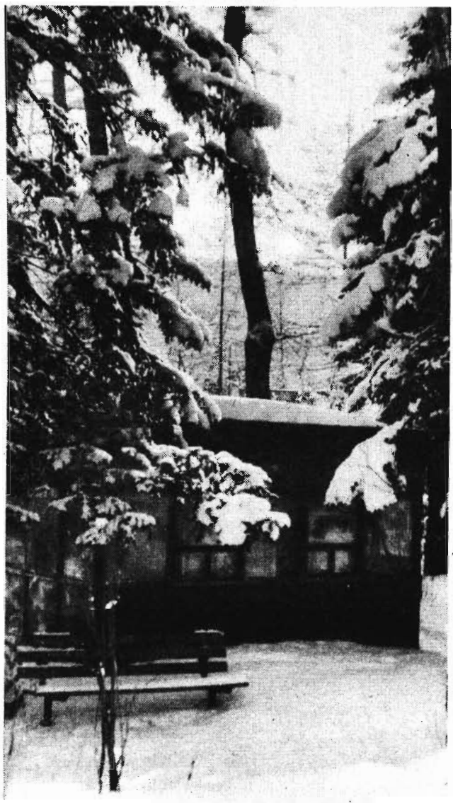
Блестя на солнце, снег ложит...