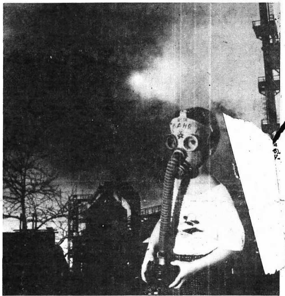
Как вас обслуживают?

А мы с вами должны понять их минутную слабость. Никто из товарищей Рысого не требует отмены его наказания. Но каждый из них верит в справедливость советского закона и суда. Ему решать судьбу милиционера. С. ЛЕНСКАЯ.