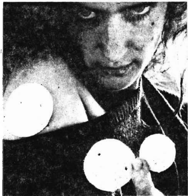
ФРГ. Трудной и болезненной остается по сей день для завалтых куряльщиков проблема расстаться, наконец, с пагубной привычкой. Облегчить им задачу взялись специалисты из южногерманского города Вер.

В роли активного помощника в борьбе с врагом человеческого здоровья должны выступить вот такие «наклейки», что демонстрирует девушка на фотографии. Прилепленные к телу подобие пластины, они содержат никотин, который на протяжении 24 часов порциями поступает через кожу в кровь, заменяя собой этот же алкалоид, вдыхаемый при закуривании сигареты. С ноября сие «лекарство» можно по рецепту приобрести в аптеках страны. «Наклейки» изготавливаются больших и малых размеров и, соответственно, разной силы воздействия. Переход при их использовании от крупных к небольшим обеспечивает постепенное снижение дозы потребляемого организмом никотина.