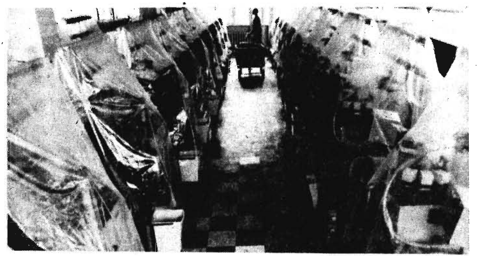
На снимке: это автоматизированное оборудование для производства носочной махровой ткани остается нерешенной во многих регионах страны. Полки магазинов пусты и в Волгограде, хотя местная чулочнотрикотажная фабрика при проектной мощности 30 миллионов пар выпускает сегодня 35 миллионов пар в год.