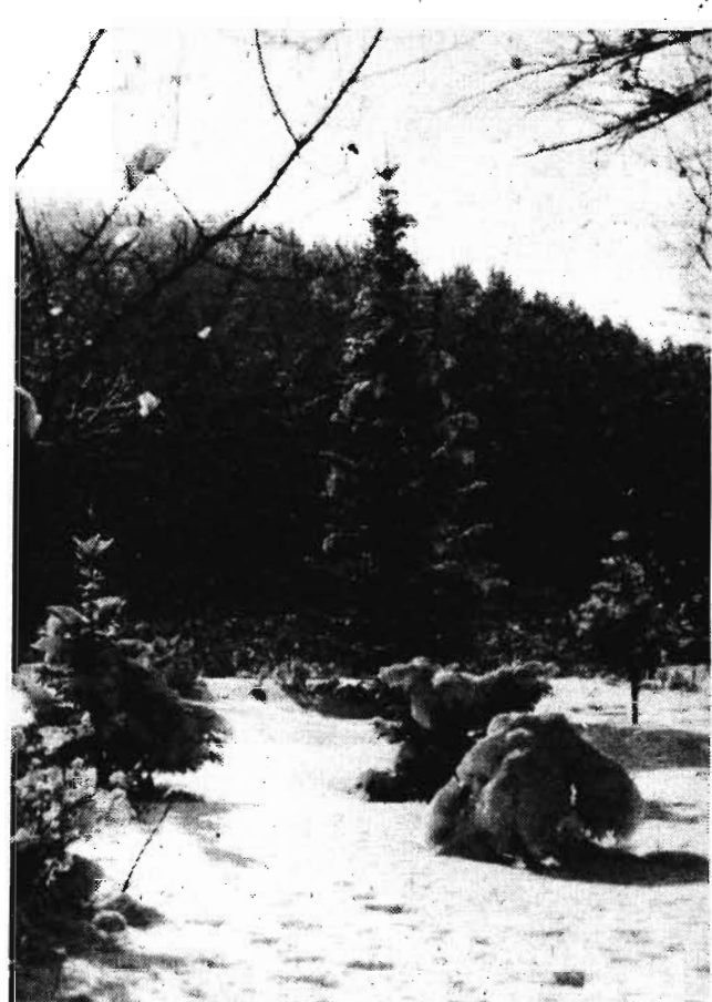
Блестя на солнце, снег лежит...