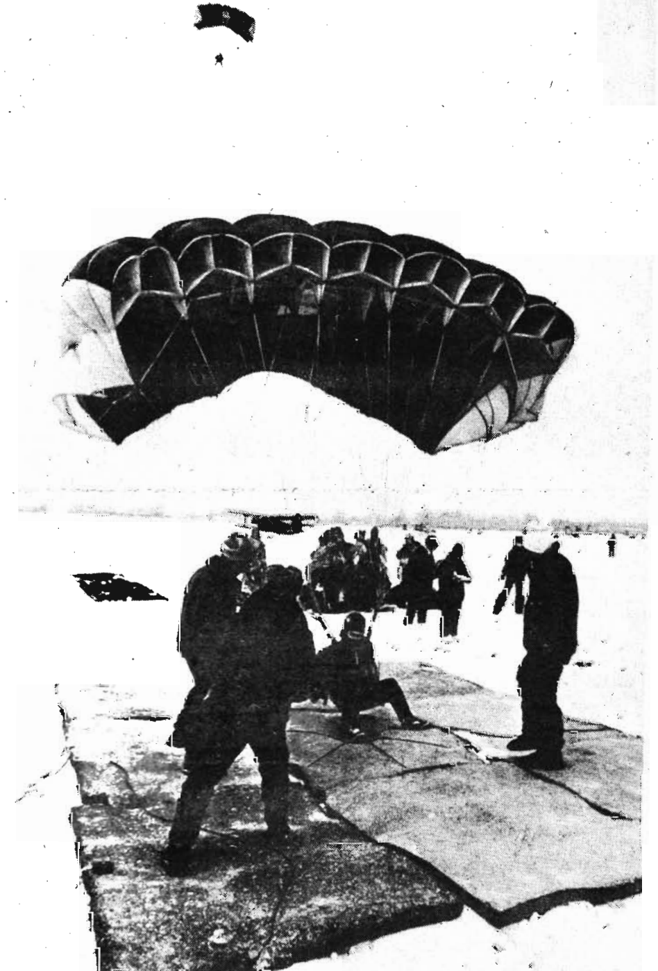
Прямо в точку.