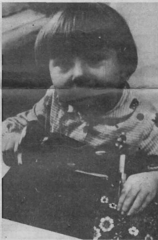
— Маме-то платье к Новому году я сошью. А вот себе не из чего. Вот беда...