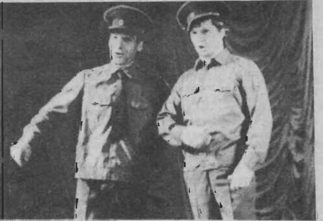
Коллективов Дворца культуры шахты им. Ярославского. Были здесь песни, звучали мелодии ансамбля народных инструментов, порадовал и «новорожденный» — коллектив бального танца. С забавной песенкой

А завершающим и самым впечатляющим, на мой взгляд, было выступление хозяев смотра —