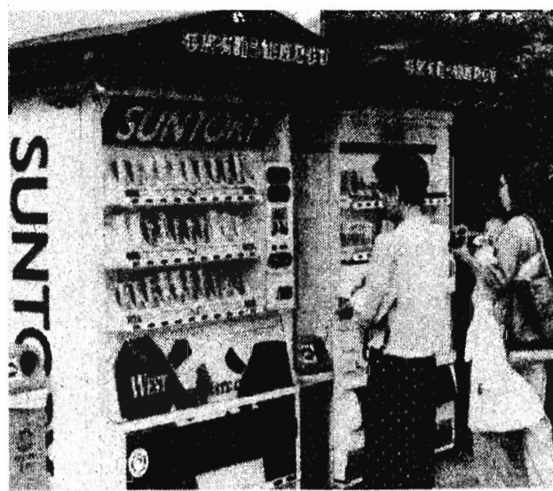
Япония. На снимке: «навязчивый» токийский сервис. Такие автоматы установлены повсеместно на улицах города и дают возможность в любое время суток взбодриться крепким кофе или отведать прохладной «газировки».