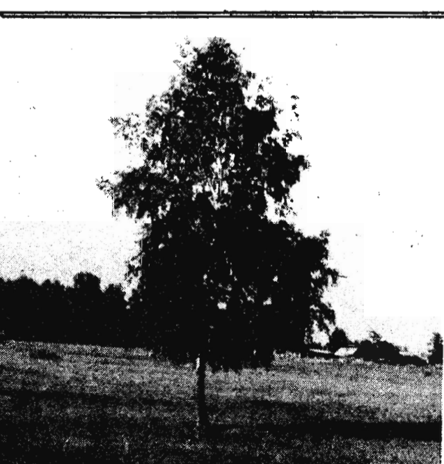
В гордом одиночестве.

Речь шла о спектакле Театра Ленинского комсомола Кузбасса, которыми он открыл свои гастроли в нашем городе.