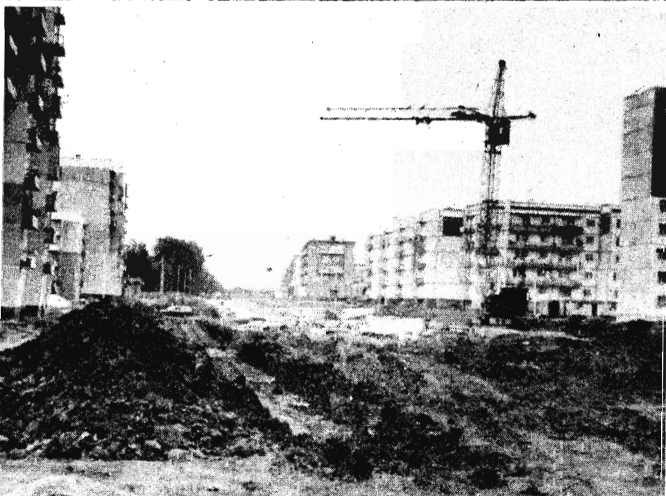
Улица Космонавтов, часть которой вы видите на снимках, приходится и на район новостроек. Жителей новых микрорайонов и без того смело можно причислять к мученикам: весной и осенью ни пройти, ни проехать, но здесь — случай особый.

ЛСУ № 3 ведет строительство магазина, который встанет вдоль улицы. Для начала — выкопана котлован. А грунт, недолго думая, оставили тут же. Кучи его верхушками своими чуть не доставали до третьих этажей стоящих рядом домов. Они же свалили у домов железобетонные конструкции.