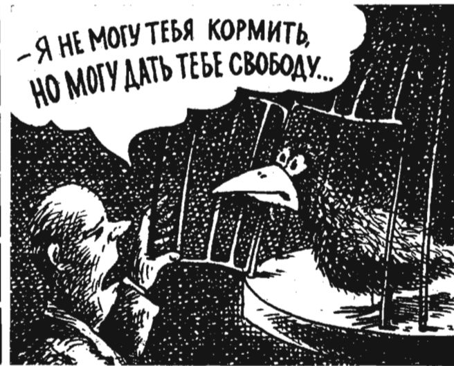
Рис. В. СЕМЕРЕНКО.