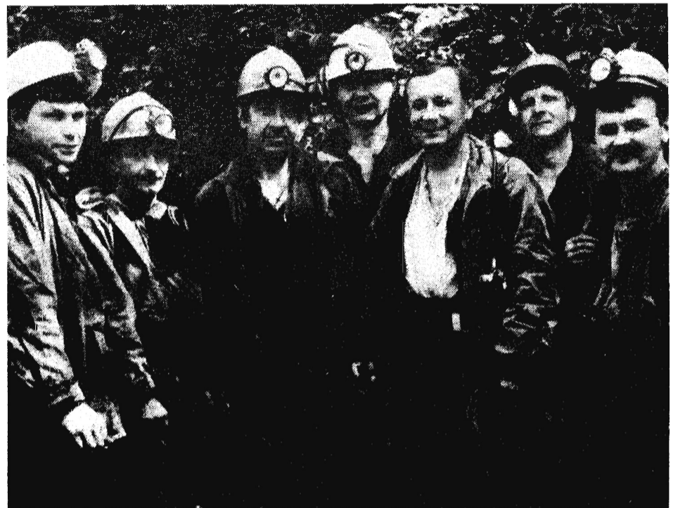
Коллектив проходческого участка № 8 шахтоуправления «Кольчугинское» ведет одновременно проходку тунельного и конвейерного бремсбергов по участку Поджуринскому-5. Несмотря на все трудности, коллектив в августе выполнил 120 метров горных выработок, из которых пять метров сверх плана. На снимке: проходчики участка № 8.

желание подробнее узнать о новом детективном фильме «Русская рулетка», покупайте завтра в киосках «Союзпечати» первый городской «Рекламный вестник». Подписчикам «Ленинского шахтера» не надо волноваться: «Рекламный вестник» им доставят на дом почтальоны.