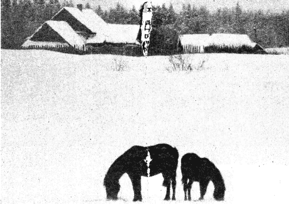
Тоска по лету.