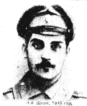
Н. А. Щорса, 1939 год.

Перед обедом на кладбище пришла группа красноармейцев с лопатами.