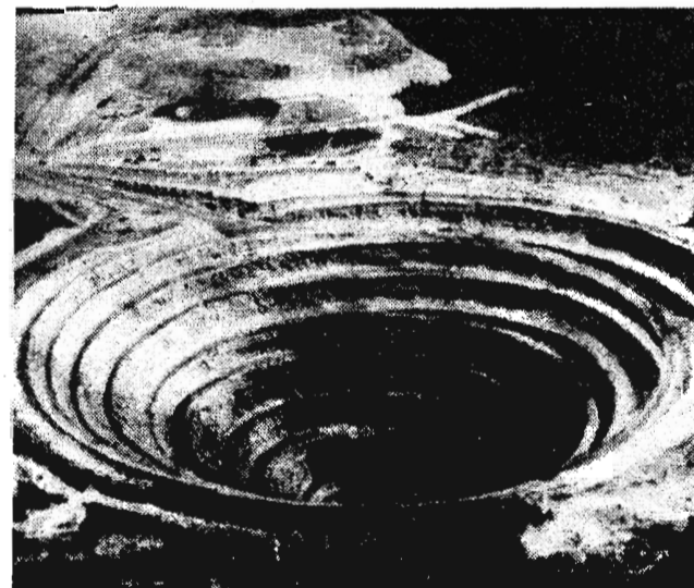
Из всех сокровищ якутской земли ценнейшим являются алмазы. На долю республики приходится более 80 процентов их союзной добычи.