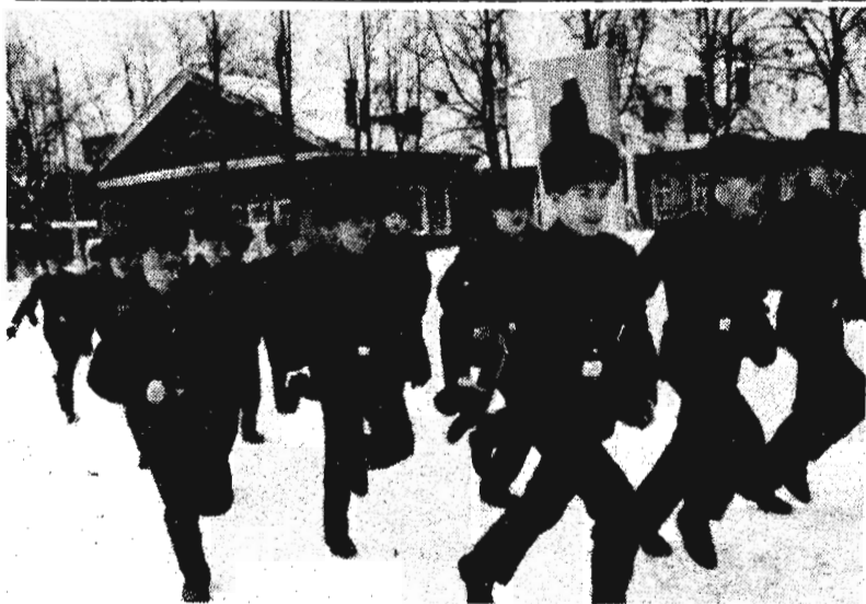
Парни с алыми погонями

В Москве есть училище, где самая высокая дисциплина среди воспитанников. Немудрено — это Московское суворовское военное училище. Приходят сюда ребята, желающие связать свою судьбу с армией, с нелегкой в любые времена службой. Сколько мальчишек, ставших в дальнейшем умелыми офицерами, вышли из его стен с октября 1944 года, когда в г. Горьком было открыто военное учебное заведение для сыновей полка.