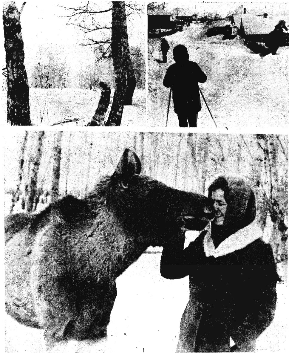
Мотивы родной природы.