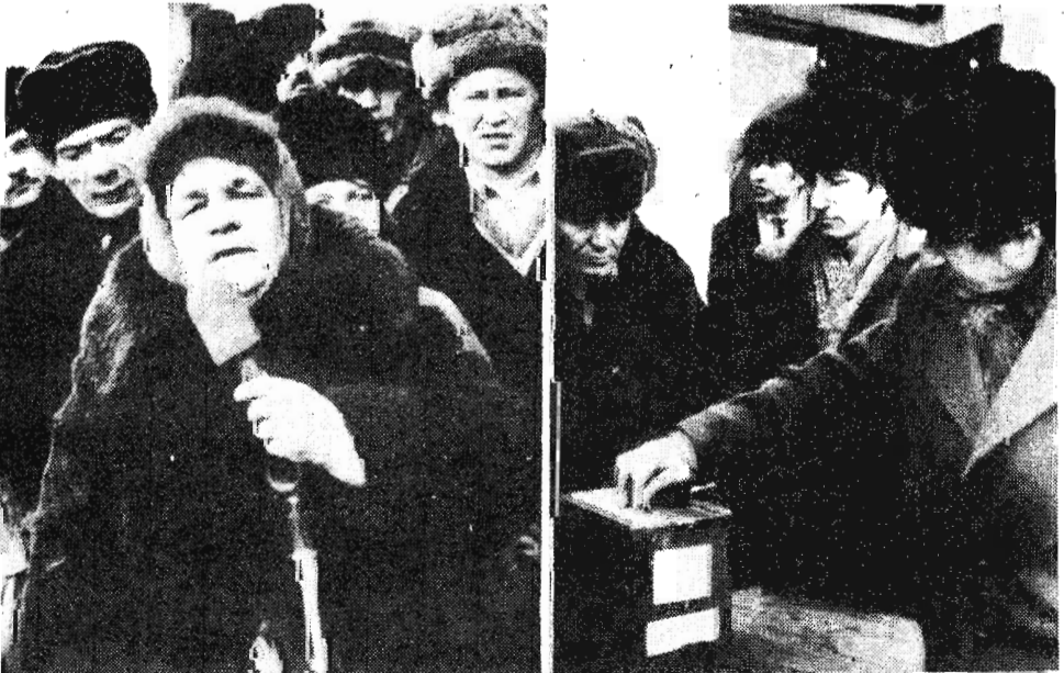
На снимках: во время митинга.