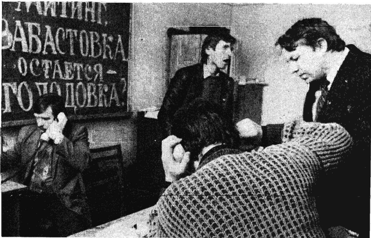
В НОВОКУЗНЕЦКОМ РАБОЧЕМ КОМИТЕТЕ.