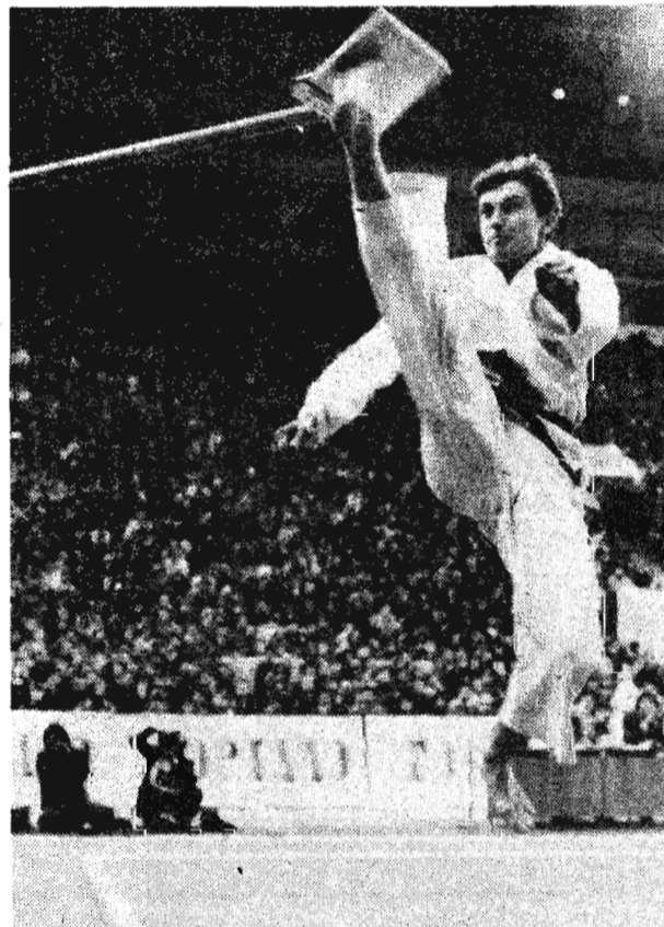
новленную на высоте более двух метров; соревнования в спарринге.

На снимках: соревнования в специальной технике, где спортсмены должны были разбить 15-миллиметровую доску, установленную на высоте более двух метров.