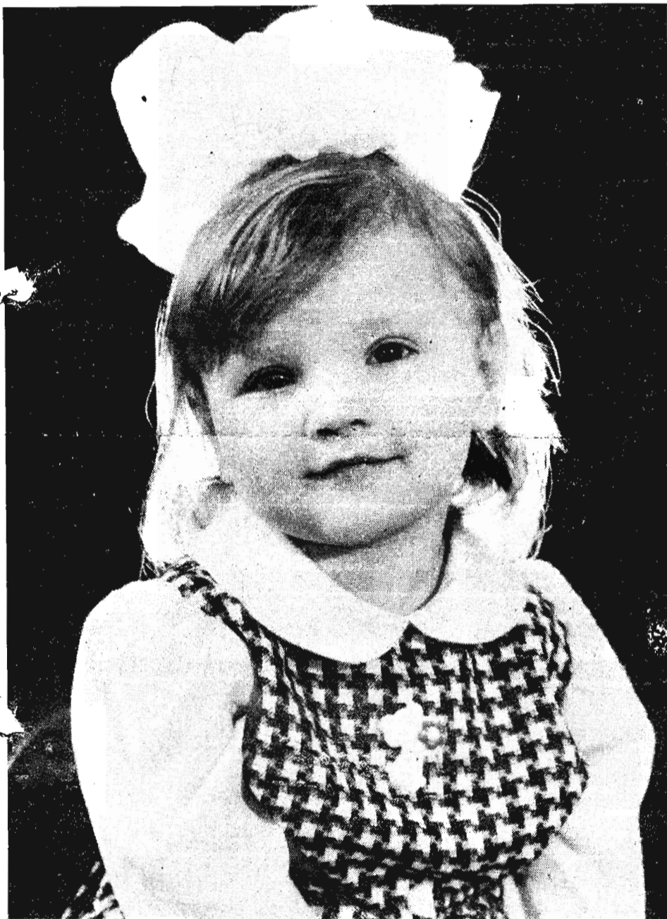
Меня зовут Катя...

1 июня — Международный день защиты детей