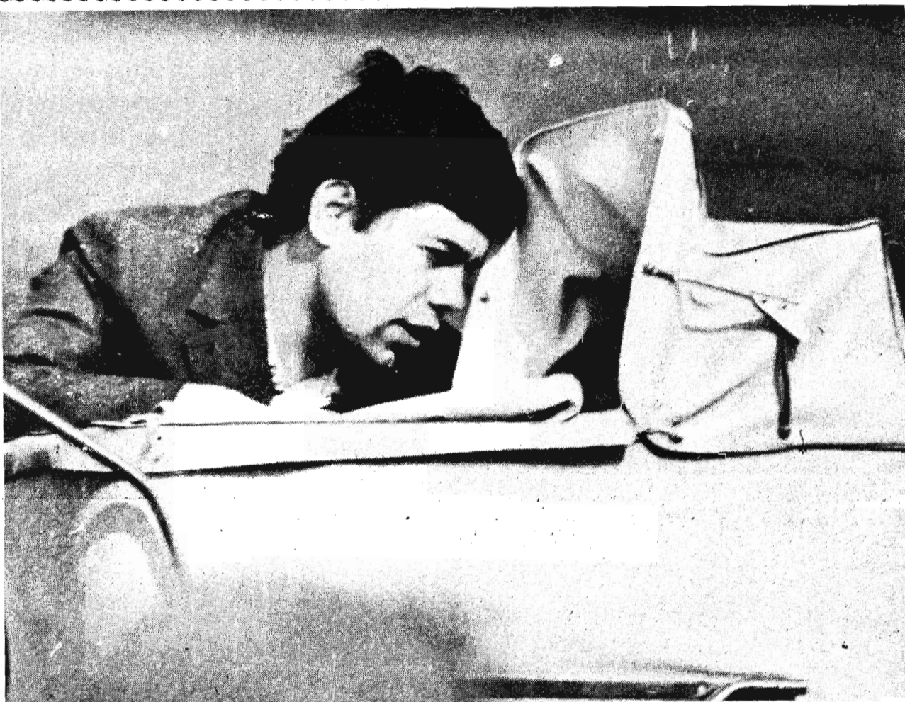
Скоро мама придет.