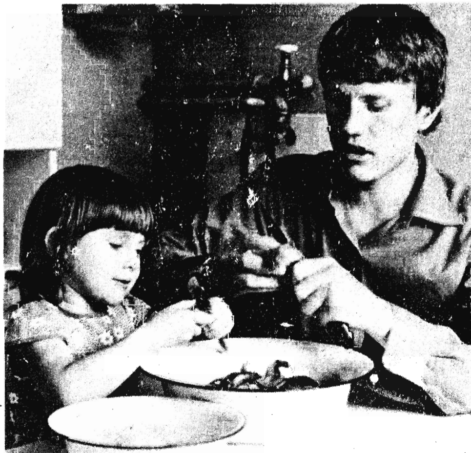
И приходу милой мамочки...