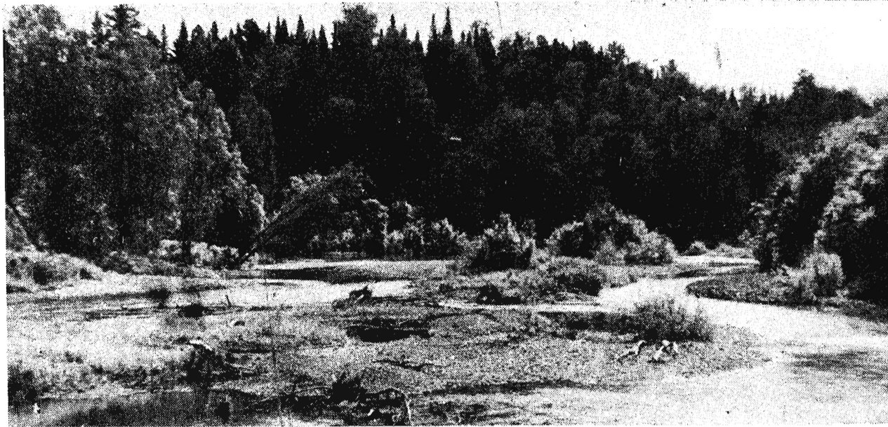
Затерялась в тайге речушка...