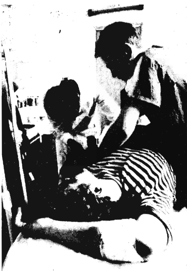
Москва, 1992 г.

На снимке: бригада «Скорой» оказывает помощь раненому в перестрелке на Курском вокзале.